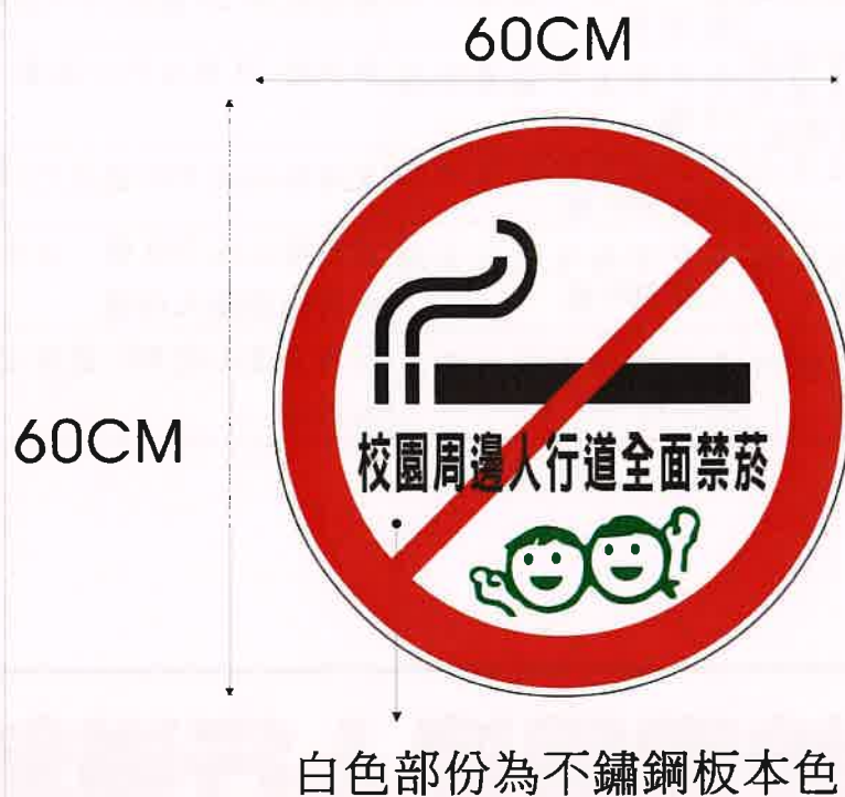
圖 2、圍牆禁菸標示牌