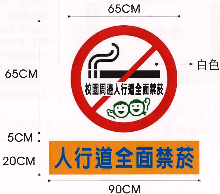
圖 3、人行道禁菸彩繪標示