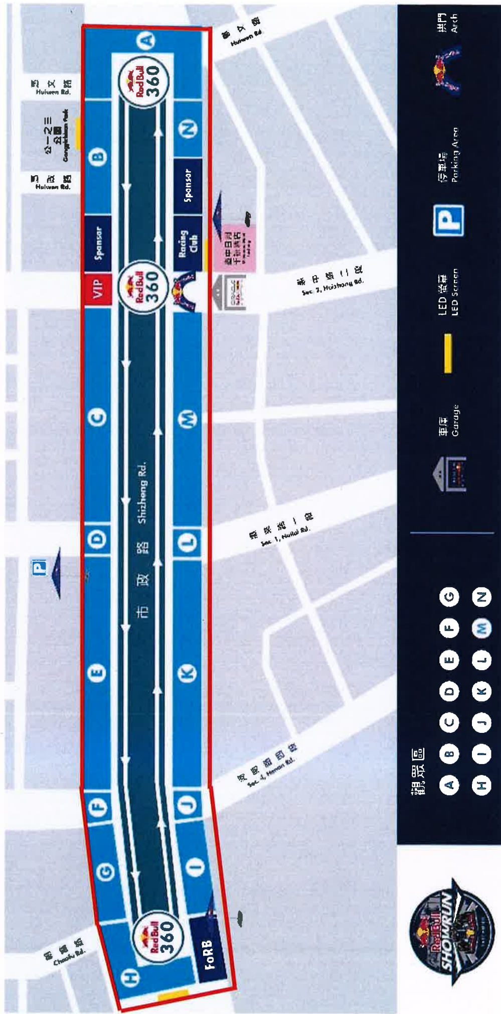
2024 國際賽車展演會場管制範圍平面圖